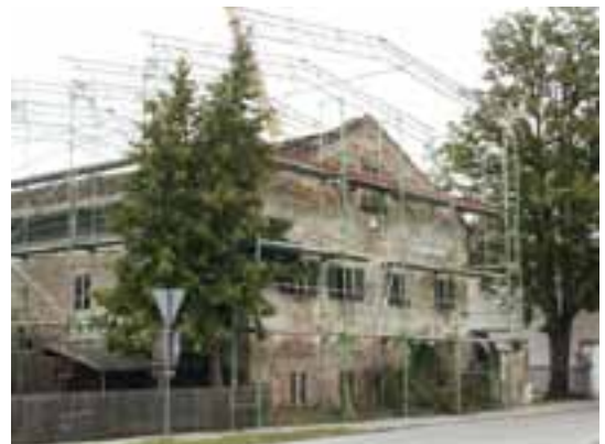
2002 erste Renovierung des Legschiefersdaches

Der Moierhof von Pfünz in unmittelbarer Nähe zur Kirche Sankt Nikolaus und dem ehemaligen fürstbischöflichen Schloss gelegen wird im Jahre 1297 erstmals urkundlich erwähnt. Ab 1586 sind die Besitzer und ihre Familien nahezu lückenlos bekannt. Allgemein war ein sogenannter „Moierhof“ in der Vergangenheit immer das größte und bedeutendste Anwesen in einem Ort, oft war der Besitzer der „Dorfälteste“ oder auch der Bürgermeister. In Pfünz wird es nicht viel anders gewesen sein, hat der Pfünzer Moierhof doch auch eine sehr bewegte Geschichte hinter sich.