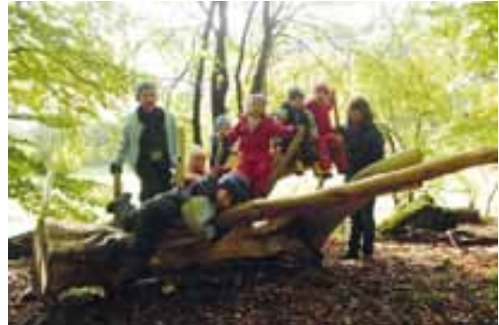
Auch im Wald gibt es einen Kletterbaum.