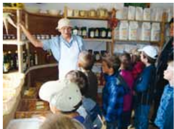
Interessant war auch der Ausflug in die Bechthaler Mühle.