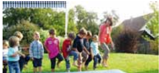
Viel Spaß macht auch das Taulaufen im Garten.

Zusätzlich bieten wir jedes Jahr einen großen Familienausflug an. Heuer ging es zum Erlebnisbauernhof nach Echen-dorf bei Riedenburg. Dieser Ausflug war mehr als gelungen. Uns wurde mit Buttern, Sägen im Wald, Seile herstellen und einem Raketenstart ein tolles Programm geboten.