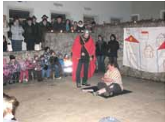
Der Elternbeirat führte das Martinsspiel auf.