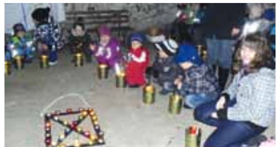
Die Kleinen und Mittelkinder nach ihrem Lichtertanz.