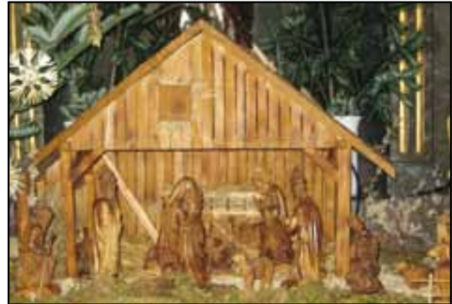
Weihnachtskrippe in der Filial-Kirche St. Nikolaus in Pfünz.

Ich danke auch dem Gemeinderat für die manchmal nicht leichten, manchmal vielleicht auch unangenehmen, aber verantwortungsbewussten Entscheidungen, ebenso der Verwaltung, unseren gemeindlichen Mitarbei-