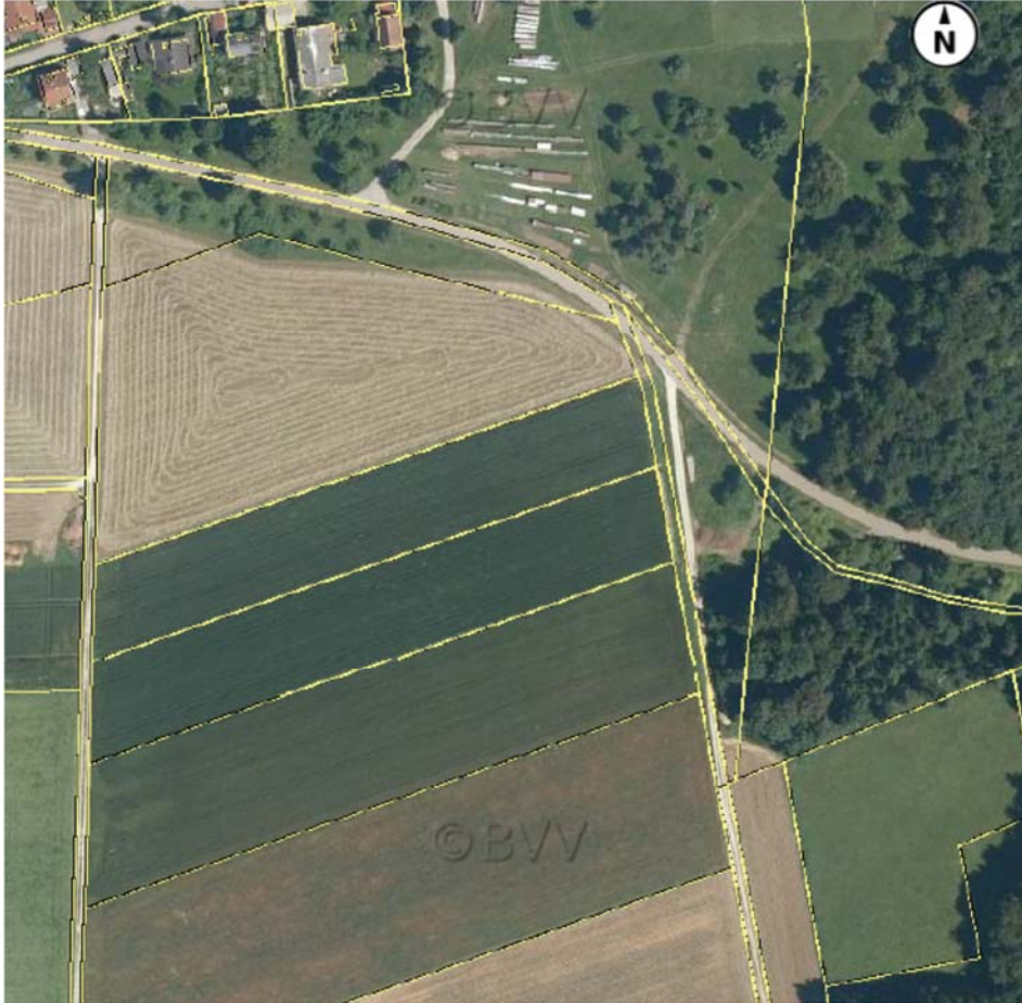
Luftbild der Fläche des neuen Holzlagerplatzes