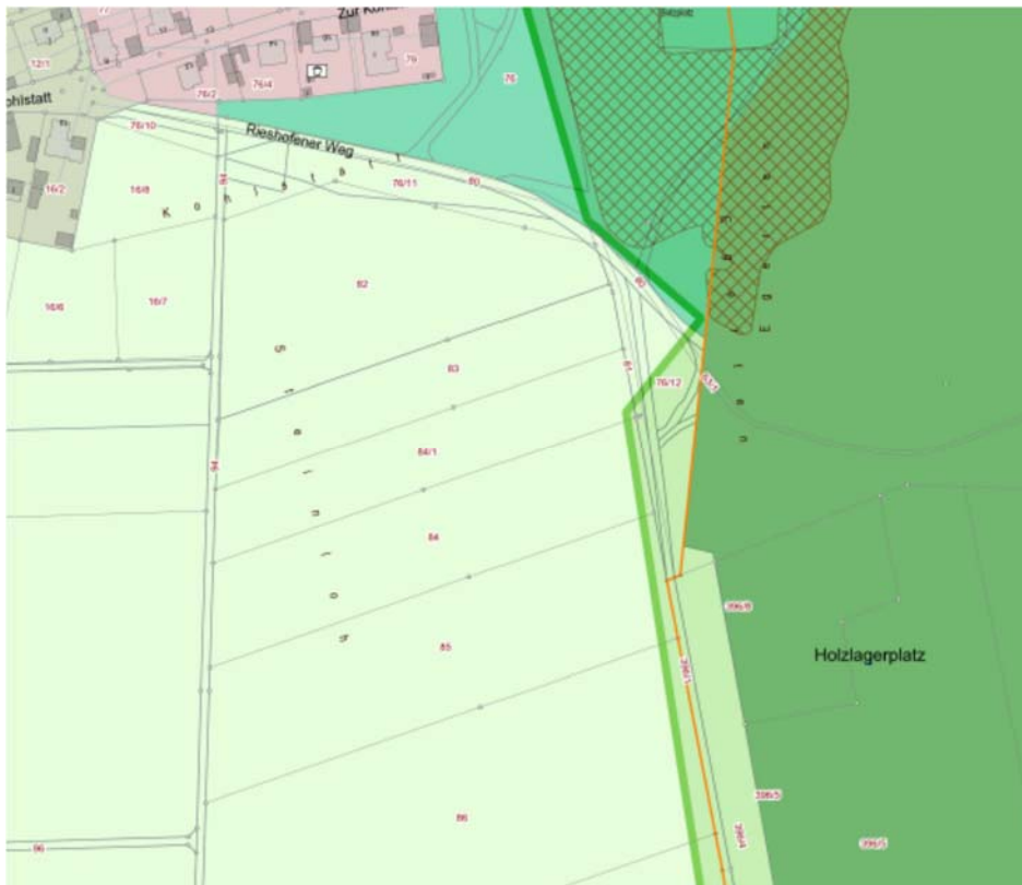
Bestand des FNP vor der Ausweisung