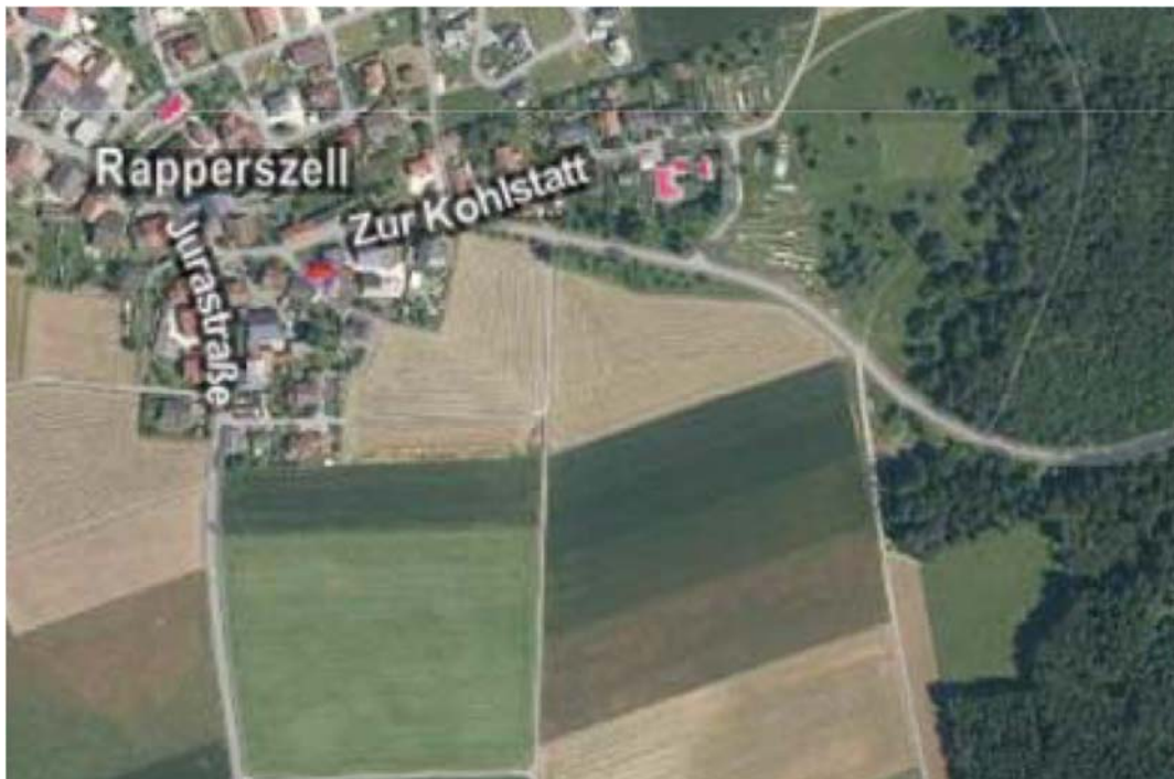
Bodendenkmäler in Rapperszell